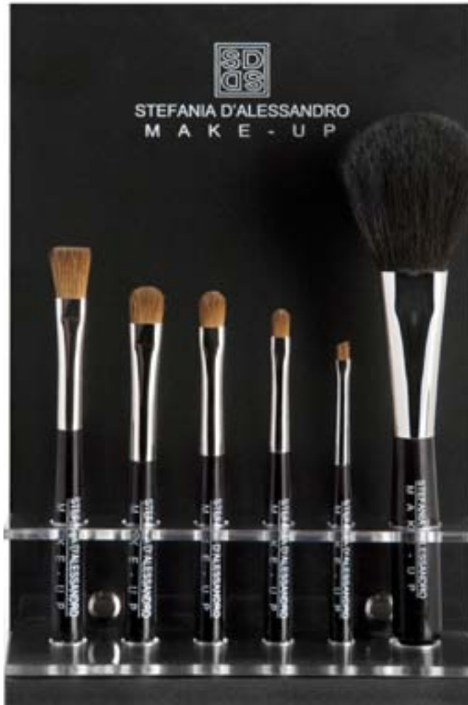
make-up brushes short display