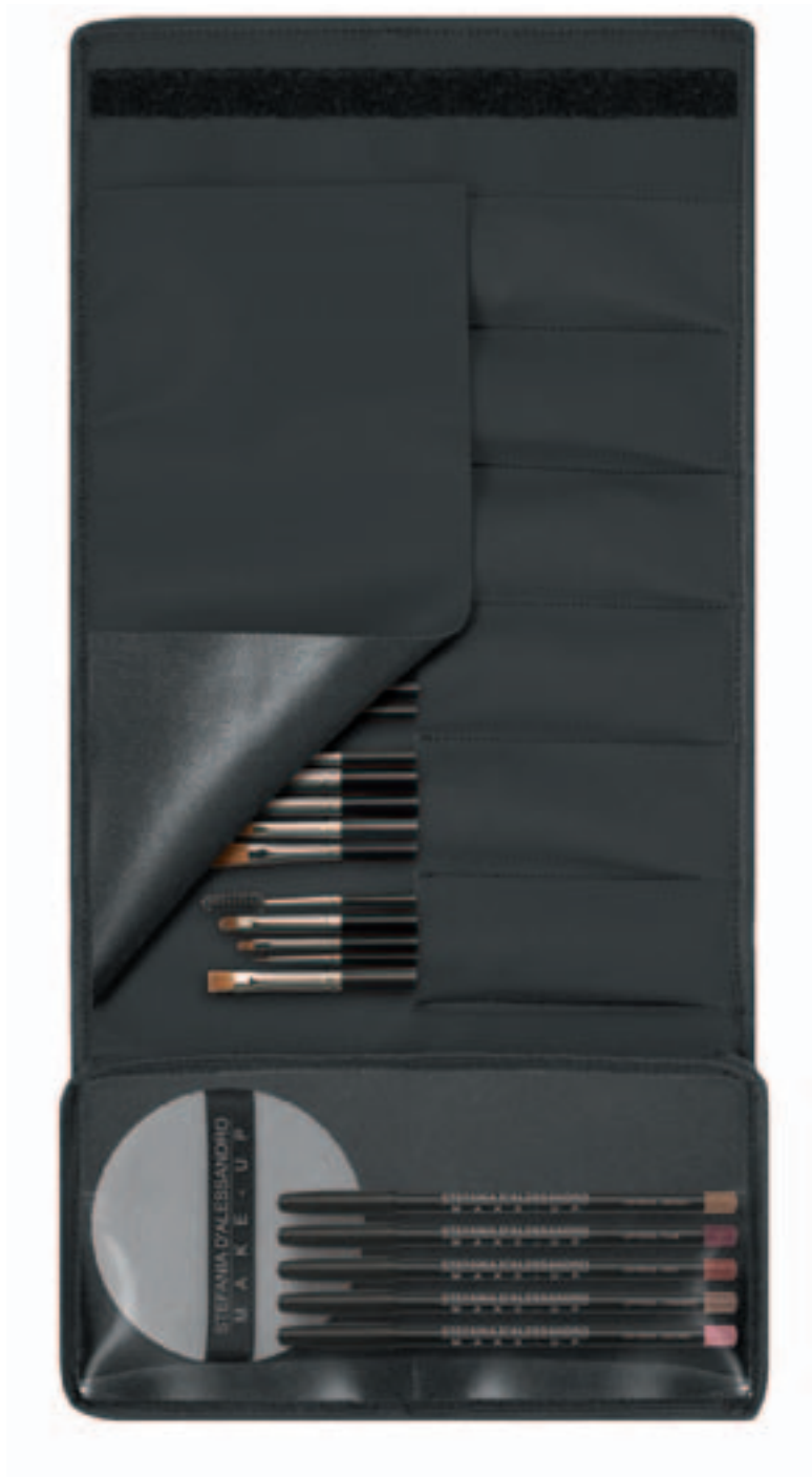
MAKE-UP BRUSHES BAG