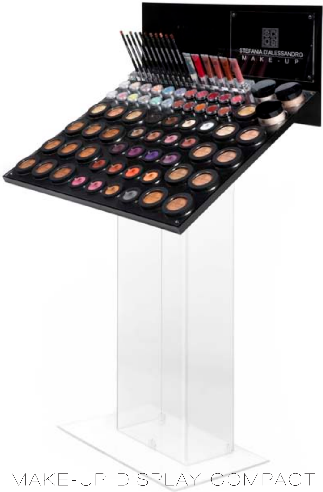
MAKE-UP DISPLAY COMPACT